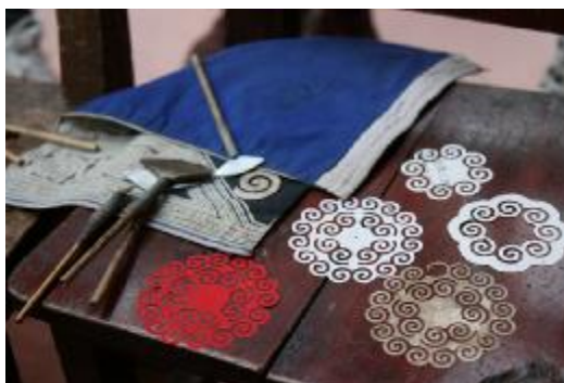
革家蜡染工具和纸模

革家蜡染图案特色鲜明，主要描绘太阳、水、花鸟、鱼塘，田螺等来源自然的生动形象，具体到百褶裙的底摆以代表水纹的涡旋图案为主。革家蜡染追求画面洁净，线条均匀，布局严谨，几何图案极其工整。实际操作中革家妇女使用剪纸作为画蜡的模板，以保证图案的统一规范。