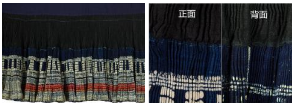
塔裙上下层接驳位置细节图

为保证穿着和洗涤过程中裙褶不会松懈散开，革家百褶裙在腰头下以每针穿透三个裙褶的跨度用链式线迹钉缝固定。