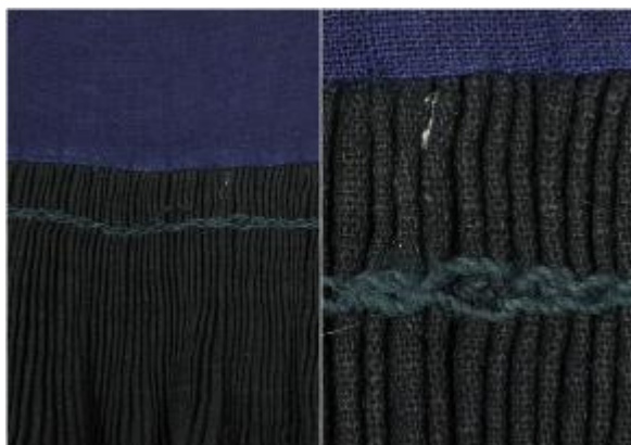
链式固定线迹显微图

为保证穿着和洗涤过程中裙褶不会松懈散开，革家百褶裙在腰头下以每针穿透三个裙褶的跨度用链式线迹钉缝固定。