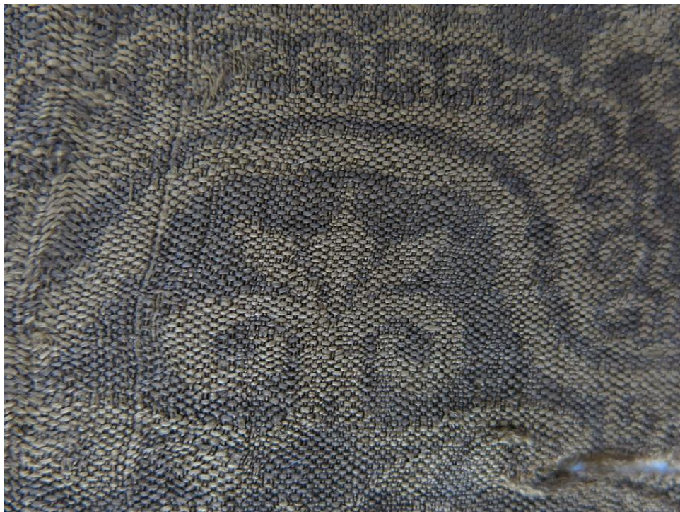
黄地楼台对兽纹锦局部

脚脚相抵之对兽配以卷云及各类花卉，是北朝时期十分流行的纹样组合。这一时期的纺织品主要出土于我国西北地区，其中主要出土于新疆、敦煌、青海等丝绸之路沿线地区。汉晋时期的图案在此时仍为沿用，陆翊《邺中记》中记载：“锦有大登高、小登高、大明光、小明光、大博山、小博山、大茱萸、小茱萸、大交龙、小交龙、蒲桃文锦、斑文锦、凤凰朱雀锦、韬文锦、桃核文锦。或青终，或白终，或绿终，或紫终，或蜀终。工巧百数，不可尽名也。其中的大登高、小登高、大明光、小明光当为文字类织锦，而大茱萸、小茱萸和大交龙、小交龙、凤凰朱雀锦显然分别是指以植物、动物为装饰主体得织锦。其风格式样与尼雅、楼兰发现的汉晋织锦相去不远。