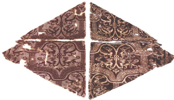
红地列堞龙凤虎纹锦 北朝 大英博物馆藏

红地列堞龙凤虎纹锦 (MAS. 926), 是敦煌藏经洞出土织物中最早的作品, 其经向排列为涡状云纹样, 此种纹样约在魏晋时期受希腊艺术的影响而大量流行与西北地区, 纬向则排列着站立的动物纹样。馆藏黄地楼台对兽纹锦纹样与此锦在纹样构成上极为相似。由于云气骨架呈曲波形, 曲波形卷云之间又有直线相连, 形成层层叠叠的楼堞形状。托名唐人的《大业拾遗记》曾记载周成王时有“列堞锦”, 这里的列堞锦很有可能就是这种涡云式云气动物纹的反映。涡状云的形式在希腊罗马艺术中极为常见, 也经常出现在中亚地区的希腊化时期的艺术中, 而在中国西北地区的魏晋艺术如栽绒毯、缂毛、蜡染棉布等织物上同样频繁出现, 与此风格最为接近的是吐鲁番阿斯塔那 TAM177 (455) 中的瑞兽纹锦。同时列堞状的结构设计则是受西方柱式圈拱建筑造型的影响, 这从罗马斗兽场的造型和新疆出土的不少列堞纹锦之间的相似处可以看出。