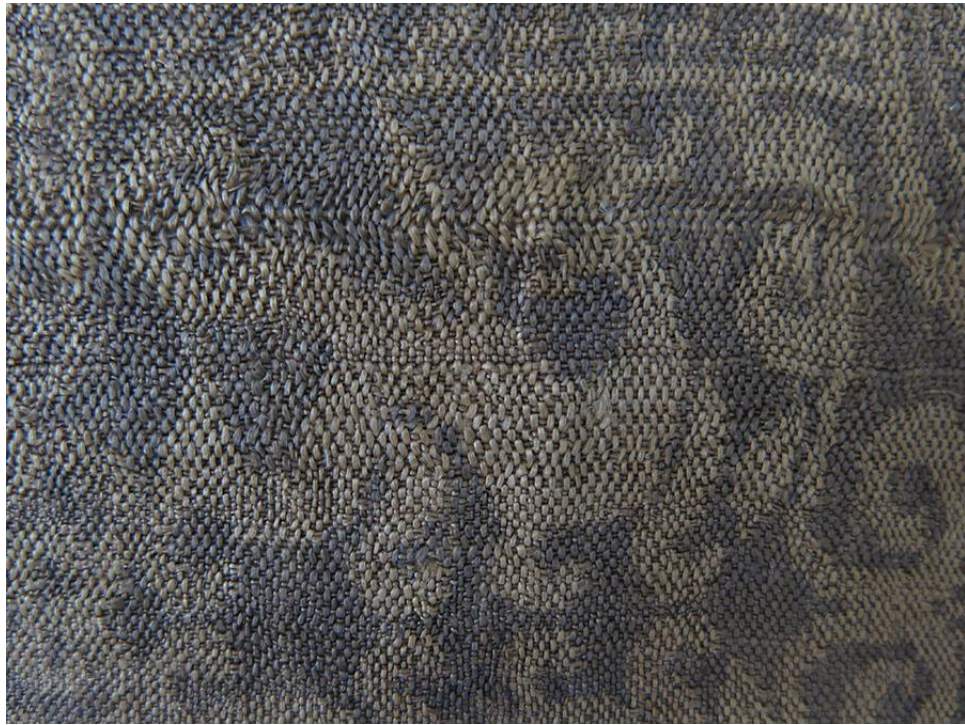
黄地楼台对兽纹锦局部

与图案的变化相关最重要的改变是织造工艺的进步，中国传统织锦自汉以来为平纹经锦，其纬线只用一色，经线用多种色，由经线显花，此后织造方式逐渐变为斜纹经锦。就纺织传统而言，不论是斜纹组织还是纬线起花，古代西亚都早于我国。北朝末年出现的斜纹经锦，是从经纬过渡到纬锦的重要一环。