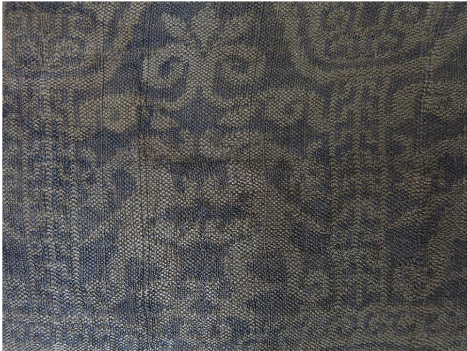
黄地楼台对兽纹锦局部

南北朝初期的织物中的兽纹，主要还是沿袭了汉锦织物上动物纹的动态和姿势，多表现为回首相望，体态多为曲折柔和之态。这依旧是继承了汉代阴阳五行等思想的影响，早在春秋时期，人们就已意识到柔的重要性。《诗经》记载：“柔远能迓，以定我王。”太极“两仪生四象”，就是天地所化的“金木水火”和“阴阳刚柔”回旋不断，这其中蕴含着丰富的哲理，含有浓厚的吉祥意味。到了南北朝后期，汉晋以来的图案风格在此时仍作延续，此织锦的风格或许是汉代云气动物纹题材的延续。只是与汉晋相比，由于文化交融互动，和受到来自萨珊波斯、印度、甚至希腊文化的影响，其纹样更加规律、程式化。