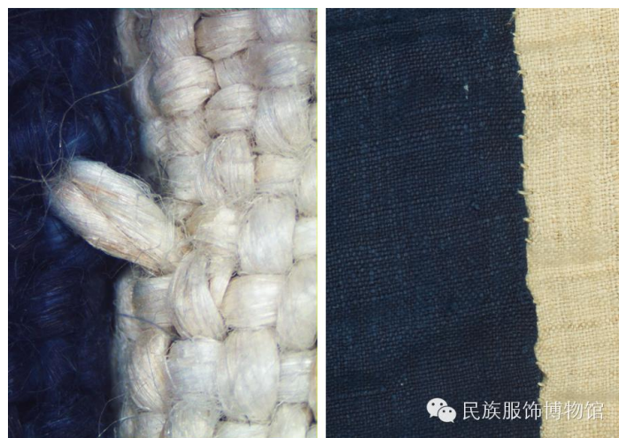
拼接繅缝针迹显微图

在上段与下摆密集皱褶的接驳位置，苗族妇女使用了巧妙的针法，使二维平面与三维立体两种结构完美衔接。