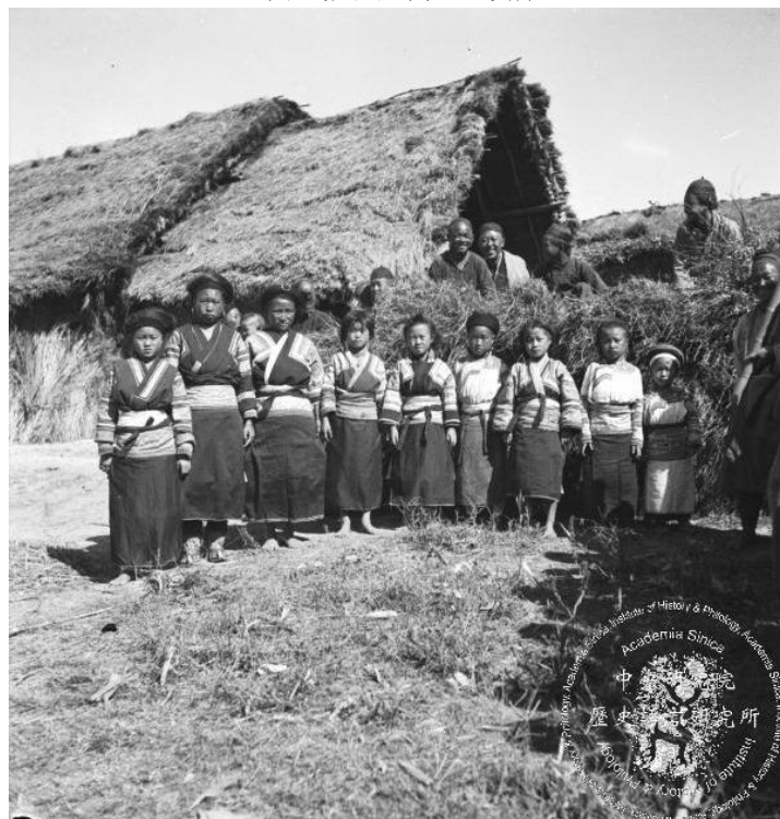
黑白老照片作品原名：一排小姑娘