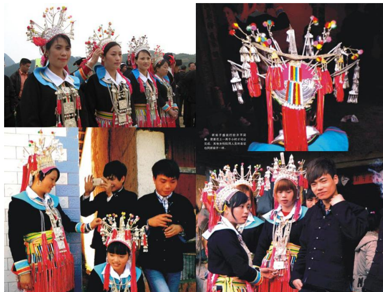
网上及书籍资料中的蓝靛瑶婚礼盛装

瑶族的“瑶”是一种他称，根据不同角度和特点，例如信仰、服饰、头饰、配饰、姓氏、居住环境、迁徙来源和生产生活方式等等，瑶族的他称多达 400 种，蓝靛瑶因穿着用蓝靛染的衣物而得名，但现在基本采用化学染。笔者之前在网上和书籍中曾看到过蓝靛瑶婚礼盛装，服饰较为简单，但头饰繁复精美，非常华丽，可是一直不清楚到底是怎样的穿戴过程。