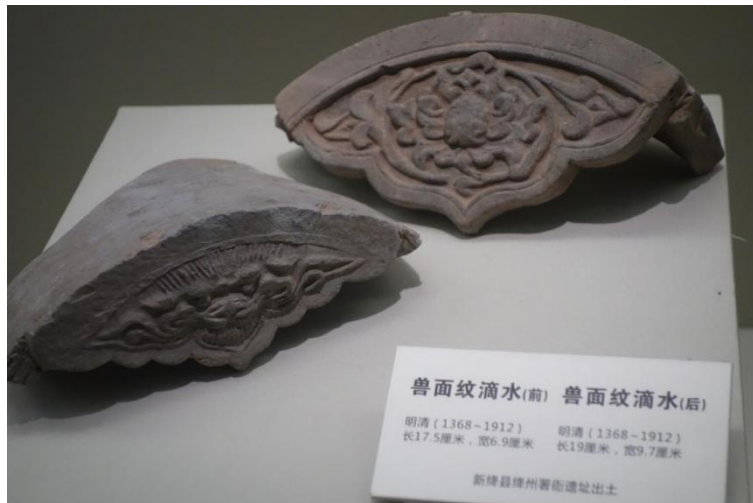
兽面纹滴水(前) 兽面纹滴水(后)

明清(1368-1912) 明清(1368-1912) 长17.5厘米, 宽6.9厘米 长19厘米, 宽9.7厘米