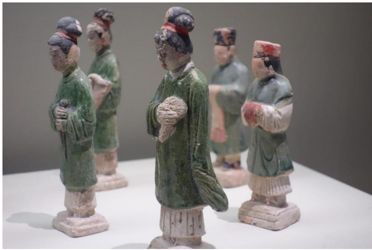
车马人物出行阵列