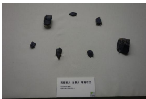
实磨石片 石制片 磨石石刀