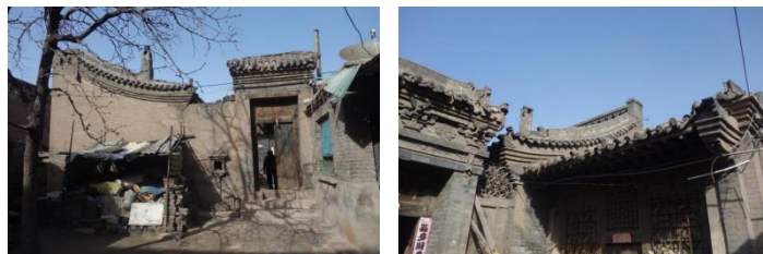
有两百年历史民用住宅

平遥古城，位于山西省晋中市平遥县，始建于西周宣王时期(公元前 827 年~公元前 782 年)旧称“古陶”。明朝初年，为防御外族南扰，始建城墙，洪武三年（公元 1370 年）在旧墙垣基础上重筑扩修，并全面包砖。以后各代进行过十次的补修。康熙四十三年（公元 1703 年）因皇帝西巡路经平遥，而筑了四面大城楼，使城池更加壮观。平遥城墙总周长 6163 米，墙高约 12 米，把面积约 2.25 平方公里的平遥县城一隔为两个风格迥异的世界。2009 年，平遥古城荣膺世界纪录协会中国现存最完整的古代县城。