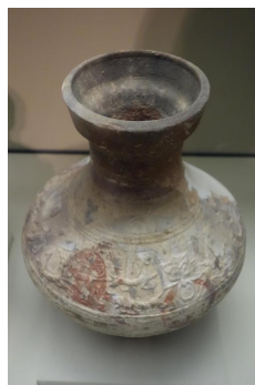
凤鸟纹尊、卜骨、陶壶