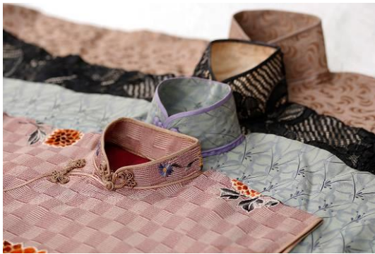
民族服饰博物馆藏品

这是一件典型的 1930 年代高领短袖扫地旗袍，选用仿喷绘效果的印花真丝面料，一片式连肩出袖的传统中式裁剪，前后衣片花型完整，即无中缝也无收省，右衽“厂”字大襟，单色窄緞边，一字直盘扣，右身侧缝全开，低开衩。