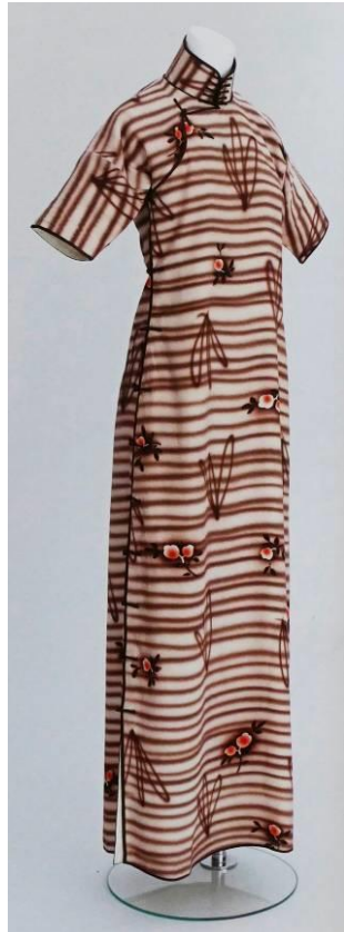
広岡女士的第一件旗袍藏品

这是一件典型的 1930 年代高领短袖扫地旗袍，选用仿喷绘效果的印花真丝面料，一片式连肩出袖的传统中式裁剪，前后衣片花型完整，即无中缝也无收省，右衽“厂”字大襟，单色窄緞边，一字直盘扣，右身侧缝全开，低开衩。