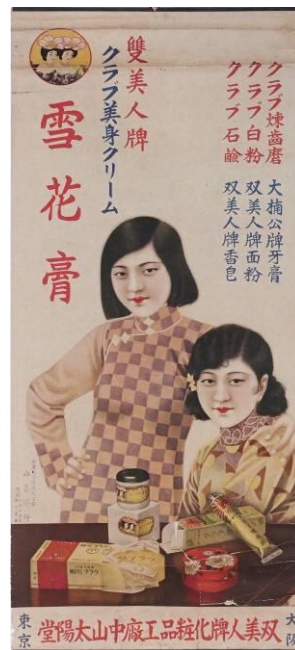
双美人牌化妆品海报