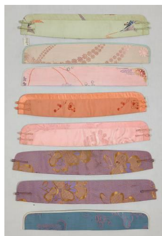
民族服饰博物馆藏品

展览当中还展示了一系列旗袍的领子，无独有偶，民族服饰博物馆的藏品之中也有一些这样单独的旗袍领。读者也许会问：单独的领子是做什么用的呢？经过配伍之后，民族服饰博物馆收藏的旗袍单领几乎都能找到与之对应的旗袍。原来，当年的裁缝师傅为一件旗袍制作两条甚至更多的领子，预备脏污或破损之后的更换，如此贴心周到的做法，增强了旗袍的实用性，是民国时期旗袍得以大行其道的一方面原因。