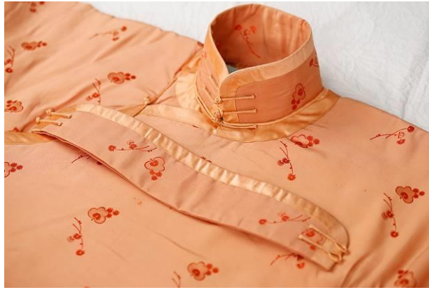
民族服饰博物藏品

聊起多年以来的收藏心得，广岡女士提到两个关键词：“解放”和“实用”。民国旗袍出现的时期，恰逢中国女性摆脱数千年的封建桎梏，融入社会生活中争取独立与自信这一时代契机。相比款型宽大的上衣下裳与繁缛的刺绣镶边装饰，旗袍以其方便舒适与含蓄简洁，恰如其分地表达了时代女性自由解放的心声，出现之后迅速得到当时社会各个阶层大多数女性的认可与喜爱。