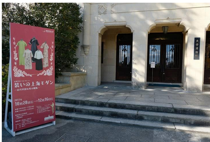
关西学院大学博物馆

日前在日本关西学院大学博物馆举办了名为“摩登上海的服装——近代中国女性服饰”的展览。