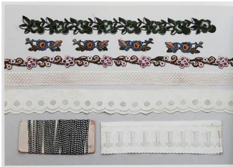
民国老花边 広岡女士藏品