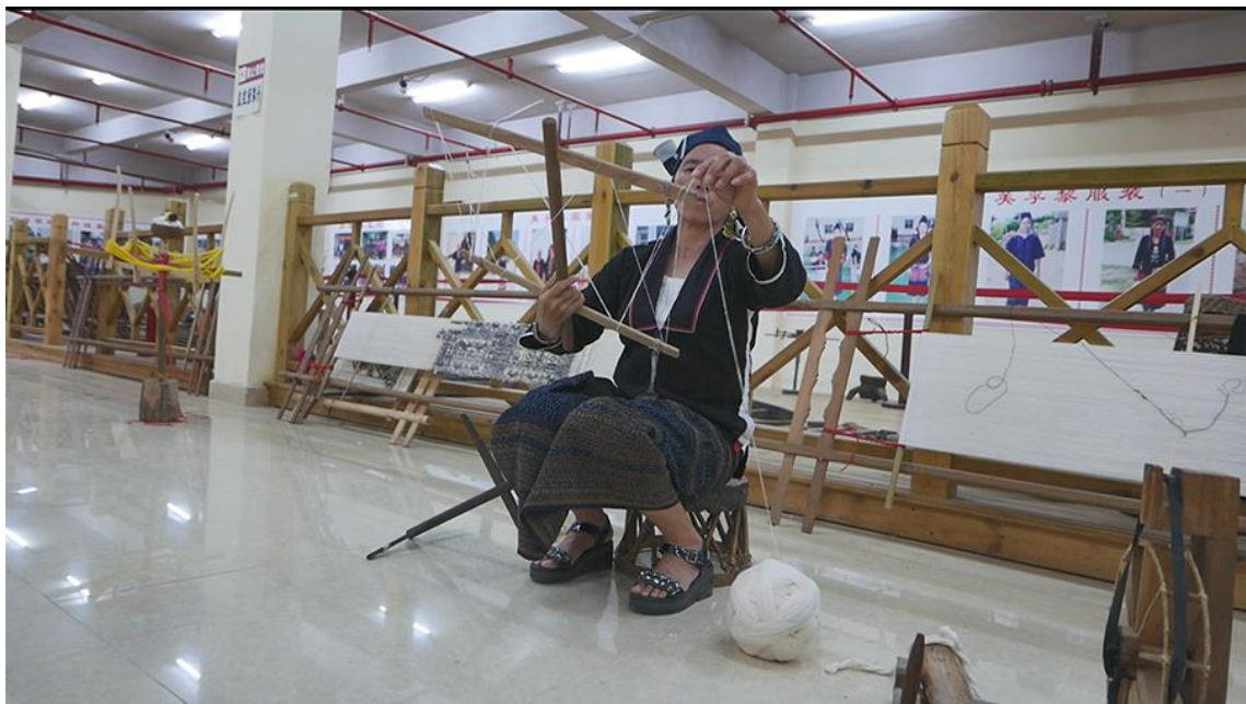
绕线到“干”字形线架

6、上经 上经的线架为“干”字形，和絣染使用的经线架是配合使用的。把上浆的经线按照固定的绕线方式一圈一圈缠绕在“干”字形线架上，每 4 圈为一组，绕好一组长线圈后取下来，就可以安在经线架上。为了使使每组线固定不能移动，排列整齐不能有重叠和交叉，要先把线圈在一个细竹棍上缠绕一圈，然后再缠绕在经线架上，把线圈绷紧。