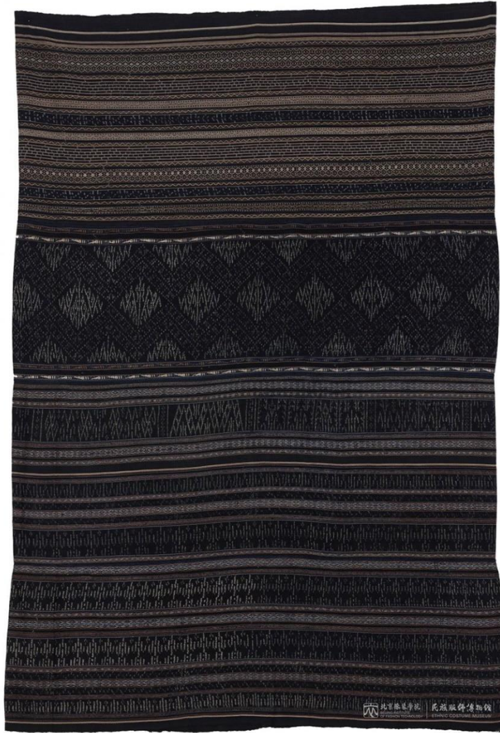
馆藏美孚黎扎经染织锦长筒裙 MFB002974

锦耗时长的另一个原因。织造好的絳染黎锦因浸染色彩相互渗透，深浅不一，晕色优美，独具一格，是黎族人民勤劳和智慧的象征。以下为民族服饰博物馆藏品美孚黎扎经染织锦长筒裙。