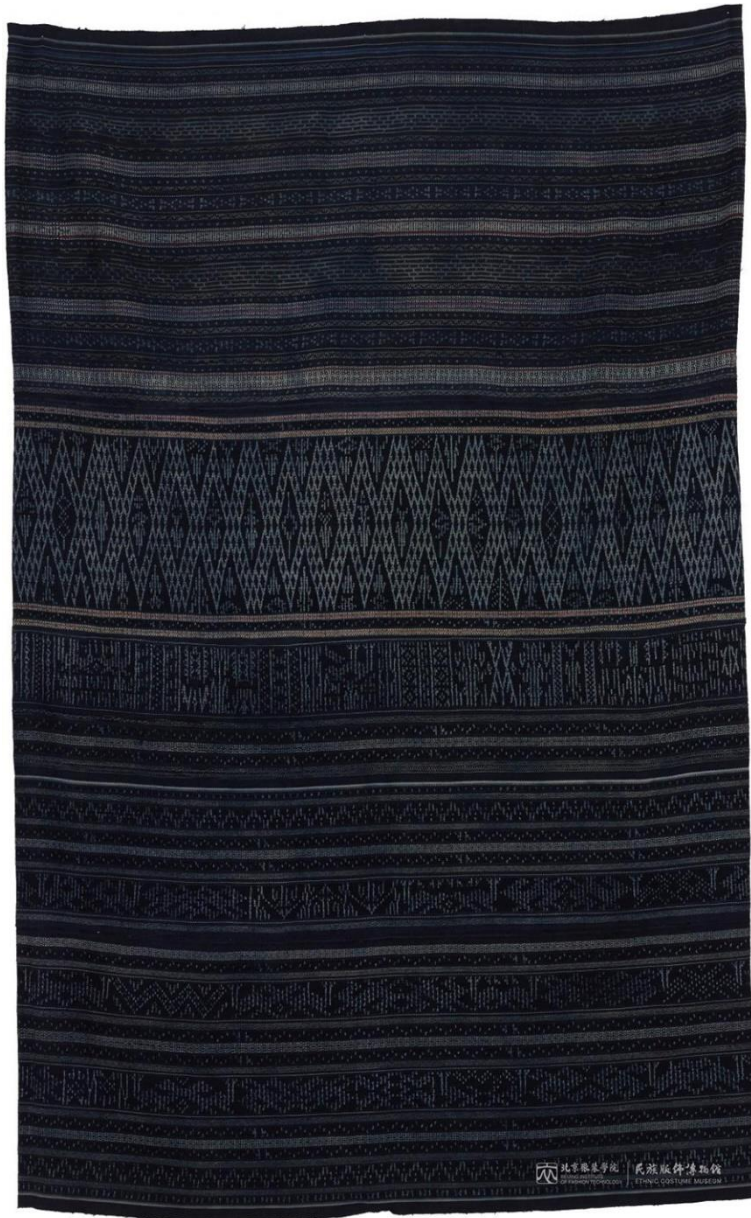
馆藏美孚黎扎经染织锦长筒裙 MFB002981