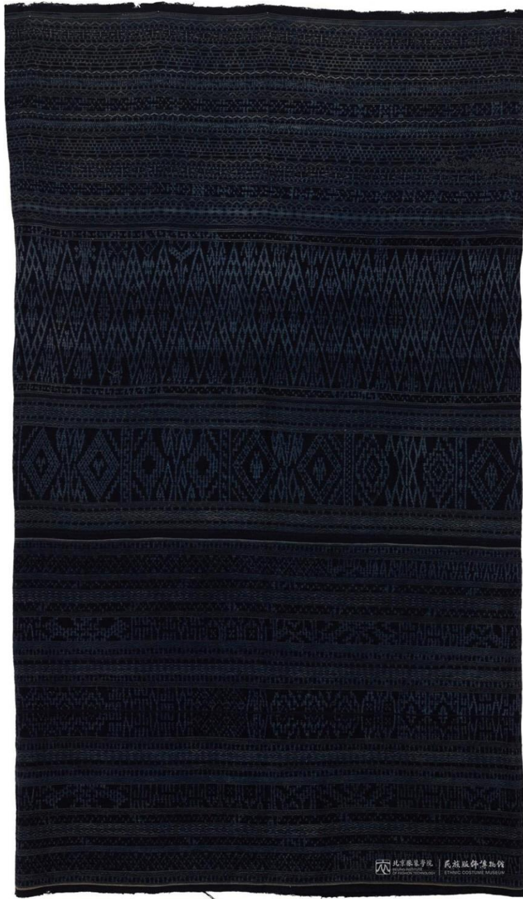
馆藏美孚黎扎经染织锦长筒裙 MFB002980