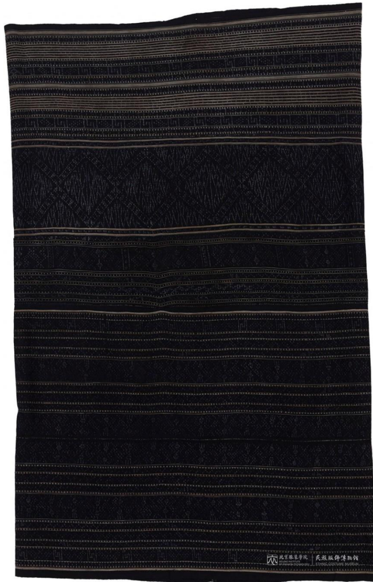
馆藏美孚黎扎经染织锦长筒裙 MFB002982