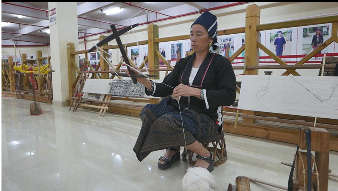
绕线到“工”字形线架

4、绕线 将纺好的棉线连接成长线，缠绕在小线架上，线架为“工”字形，上下两根横木呈 90°交叉。线需要按照一定的方法，缠绕成线卷，然后取下来，以备上浆。