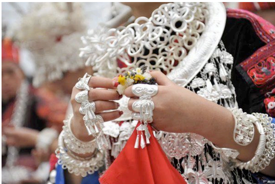
佩戴示意图